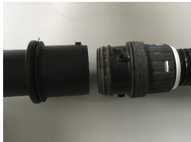
Bild 3: links: Anschlussmuffe Kärcher alt (Bajonett 1.0) mit einer Rastnase, rechts: Kärcher neu (Bajonett 2.0) mit drei Rastnasen und geänderter Ausbildung.