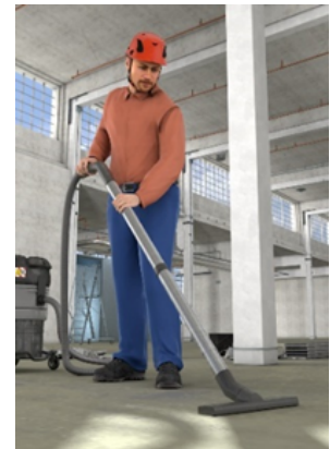
Bild 1: Baustellenreinigung mit Entstauber und Sauggarnitur

Es ist uns kapazitätsmäßig nicht möglich , Anfragen zu alternativen Sauggarnituren zu bearbeiten! Bitte wenden Sie sich bei Interesse an einer Listung anderer Sauggarnituren ausschließlich an den jeweiligen Kontakt-Partner der oben aufgeführten Hersteller. Vielen Dank!